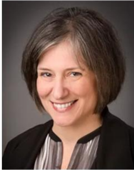
璞富腾酒店及度假村公司总裁