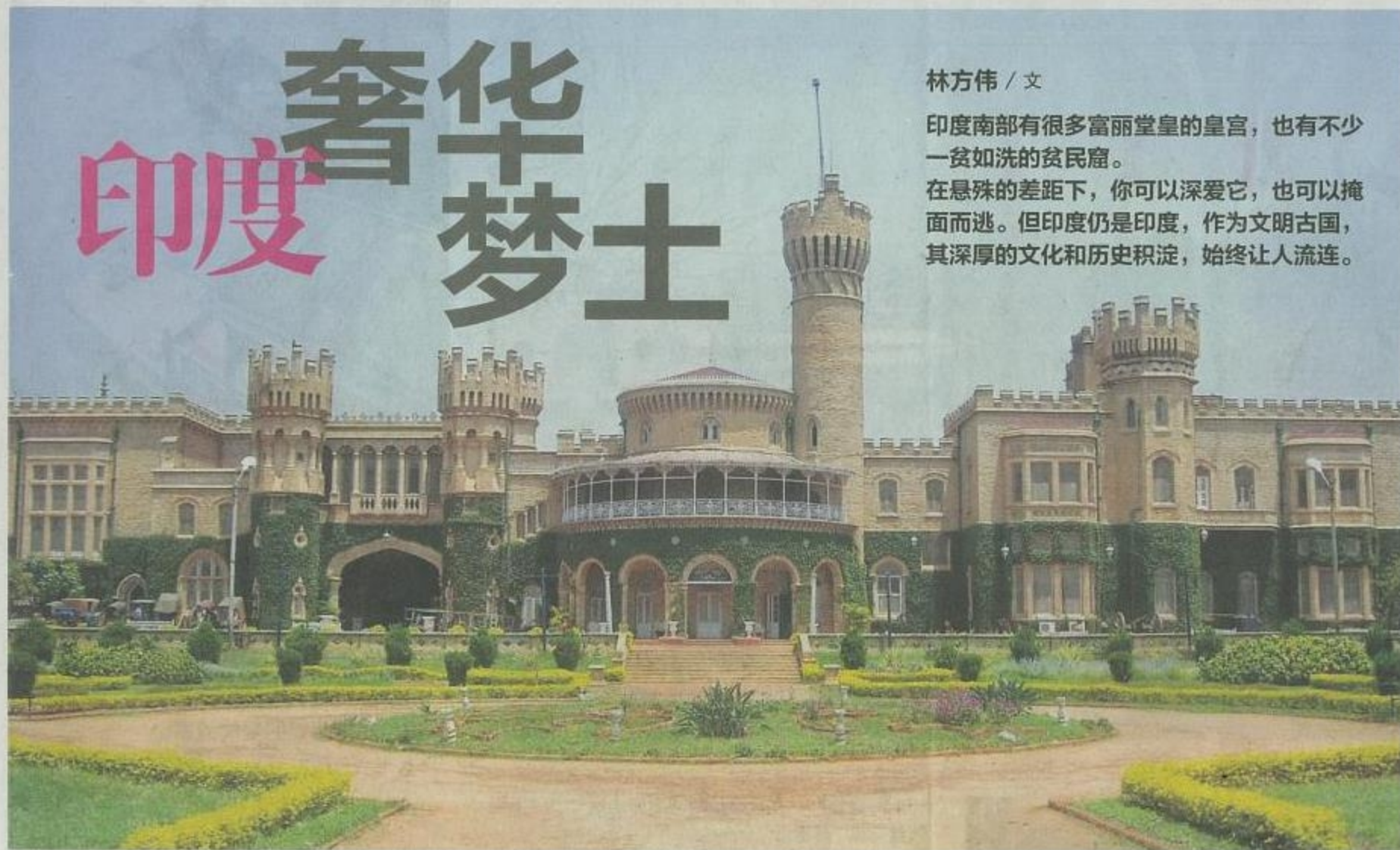
1944年建成的班加罗尔皇宫是迈索尔帝王的夏季行宫。