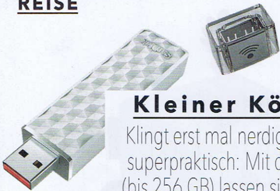
Connect Wireless Stick von SanDisk (ab ca. 30 €)